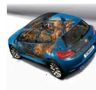
CAN Datenbus Martin Treffler