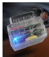
VAG / OP COM Dirk Junghans