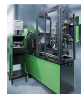
Aggregate Instandsetzung (*nur bei Steinmetz in Kürnach)