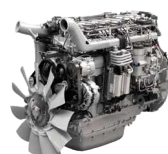
komplette Motorenfertigung (*nur bei Bauer in Weilheim!!!)