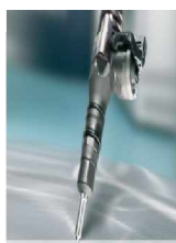
Unit Injector Systeme Steve Kistner